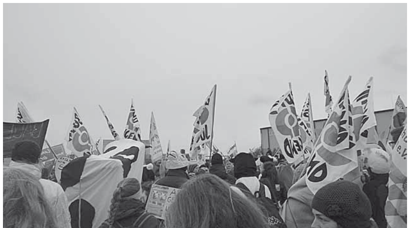
Das beeindruckende BUNDjugend-Fahnenmeer auf der Demo in Berlin

Uns war besonders die Beteiligung aus Schleswig-Holstein sehr wichtig, denn wie euch allen sicher bekannt ist, war es das Land Schleswig-Holstein, das die Förderung der Biobetriebe gekippt hat!