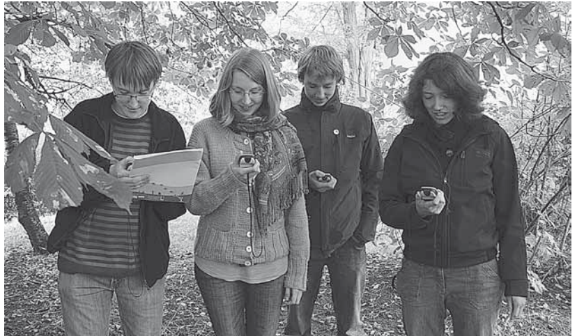
Jugendliche beim Eingeben von Koordinaten in ein GPS-Gerät

Geplant werden Routen für Kinder von sieben bis 14 Jahren, aber für Erwachsene rund um das Thema Ostsee. Startpunkt wird für jede Route das Umwelthaus sein, die je nach Umfang schon mal bis Pelzerhaken reichen kann.