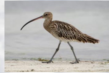
8 Großer Brachvogel