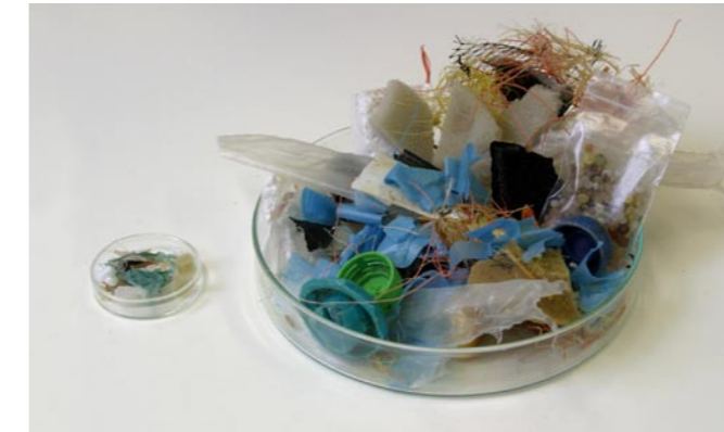
15 Plastikmüll, links im Bild Mageninhalt eines toten Eissturmvogels, rechts vergleichbare Menge für einen Menschenmagen

Auch der Plastikmüll in den Meeren ist eine große Gefahr für Vögel. Ob ein Tier sich in Resten von Fischernetzen verheddert und dadurch stirbt, oder ob es treibenden Plastikmüll für Nahrung hält und schluckt, bis der Magen irgendwann voll ist. Plastik in den Meeren wirkt auf verschiedene Arten tödlich.