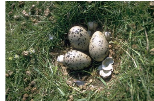
12 Nest vom Austernfischer

An der Nordseeküste gibt es das Wattenmeer, weil hier die Gezeiten wirken können. In der Ostsee dagegen kann nur ein starker und anhaltender Wind Windwattflächen verursachen, die vielen Vögeln Nahrung bieten. Die Ostsee ist ein Brackwassermeer, die Nordsee hat außer in Küstennähe einen Salzgehalt wie die großen Ozeane. Wegen des geringeren Salzgehalts und des stärker wirkenden Kontinentalklimas friert die Ostsee auch schneller zu als die Nordsee. Für viele Vogelarten bietet die Nordseeküste beständigere Verhältnisse und deshalb sind dort die Zahlen von Rast- und Zugvögeln höher als an den Küsten der Ostsee.