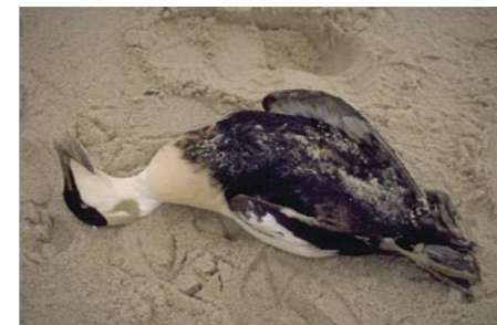
14 Tote Eiderente

Ölverschmierte Vögel sind nicht überlebensfähig, weil sie nicht mehr fliegen und tauchen können und außerdem Körperwärme verlieren. Bei dem Versuch, ihr Gefieder zu reinigen, nehmen sie Öl auf, was zur Vergiftung und zum Tode führt. Deshalb rettet auch das Einsammeln und Säubern von verölten Vögeln nur sehr wenigen vielleicht das Leben. Aber viel wichtiger ist, zu verhindern, dass Rohöl und daraus gewonnene Produkte überhaupt in die Meere gelangen. Denn nicht nur bei großen Katastrophen wie Unglücken auf Bohrinseln oder leck geschlagenen Schiffen fließt Öl ins Meer. Jeden Tag wird illegal Altöl von Schiffen in die Meere geleitet, um die Kosten für eine umweltgerechte Entsorgung an Land zu vermeiden.