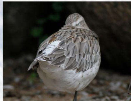
11 schlafende Pfuhschnepfe