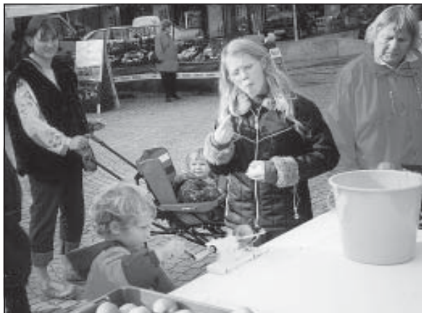
Spass mit der Apfelschälmaschine