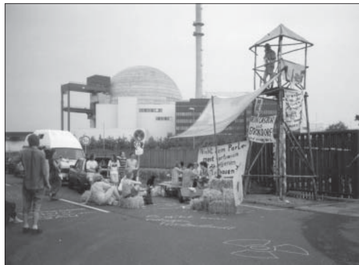
Unser Protest wird weitergehen