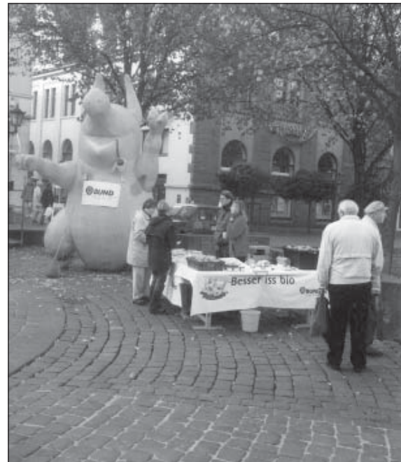
Berta auf Deutschlands größtem Markt- platz in Heide

genauer gesagt, um deren verstärkten Einzug in die Supermärkte zu forcieren. Das nach dem BSE-Skandal verkündete Ziel der Bundesregierung heißt 20 % Öko-Landbau bis zum Jahr 2010. Soll es tatsächlich Erfolgsaussichten haben, wird der Weg eines deutlich stärkeren Verkaufs über die Supermärkte unumgänglich sein. Österreich und die Schweiz haben es vorgemacht. Wenn die Menschen, die Bio-Wa-