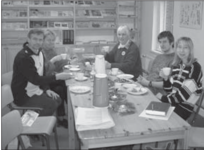
BUND Arbeitskreis Atomausstieg tagt in Rendsburg

richsen, wissenschaftlicher Beirat Atomenergie des BUND S-H , am 8. Dezember 2001 in Rendsburg