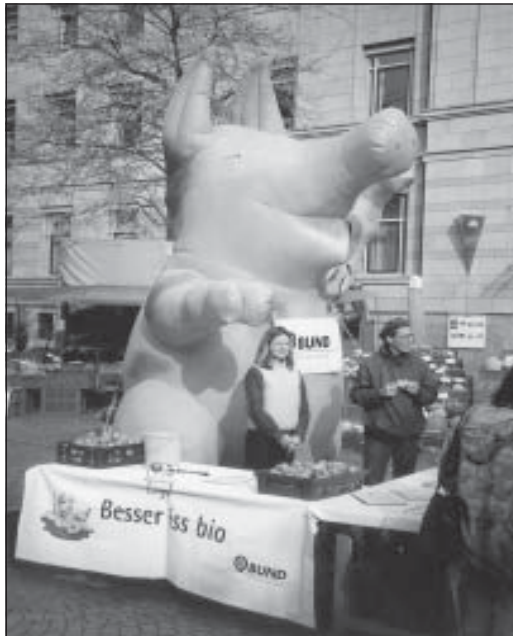
Sau Berta in Kiel

Als „Berta“ am 19. Oktober 2001 in Kiel ankam, war ihr Käfig bereits den zahlreichen Werbe-Einsätzen zum Opfer gefallen. Nichtsdestotrotz war sie der Blickfang des Öko-Wochenmarktes auf dem Asmus-