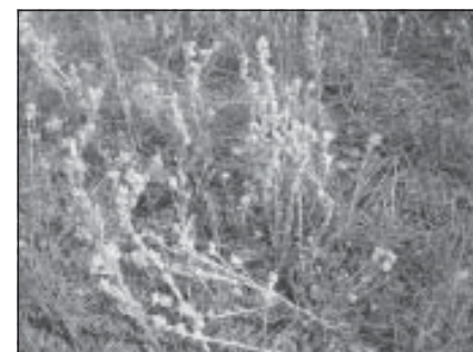
Filzkraut auf der Lohe