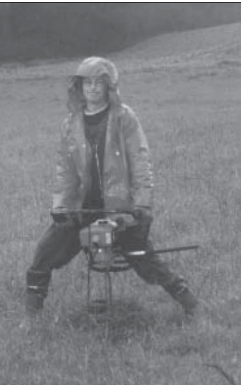
Schweres Gerät hilft bei der Pflanzaktion in Neversfelde