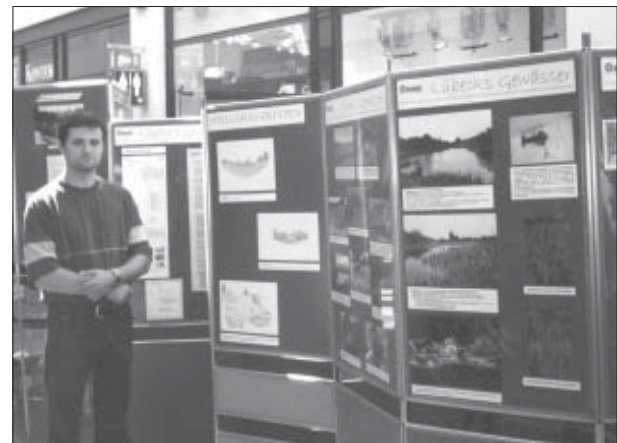
Ausstellung Lübecks Gewässer

sich viele mit hoher ökologischer Bedeutung. Sie bieten Lebensraum für mannigfaltige Wasser- und Uferpflanzen (darunter befinden sich viele Arten, die auf der Regionalen Roten Liste Lübeck stehen). Ziel des Projektes ist es, einen Zustandsbericht über Lübecker Gewässer zu erhalten. Ein solches Werk dient als Arbeitsgrundlage für den Umwelt- und Naturschutz, denn nur was man kennt, kann man vor Eingriffen (z.B. im Zuge der Bebauungsplanung) bewahren und wirkungsvoll schützen. BUND KG Lübeck