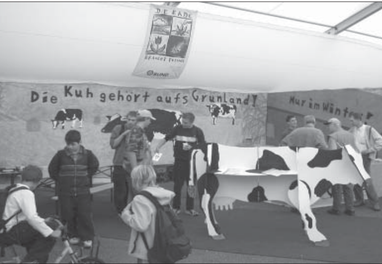
Die Kuh gehört aufs Grünland !

Außer Agrarpolitik auch Spiel und Spaß am BUND Stand