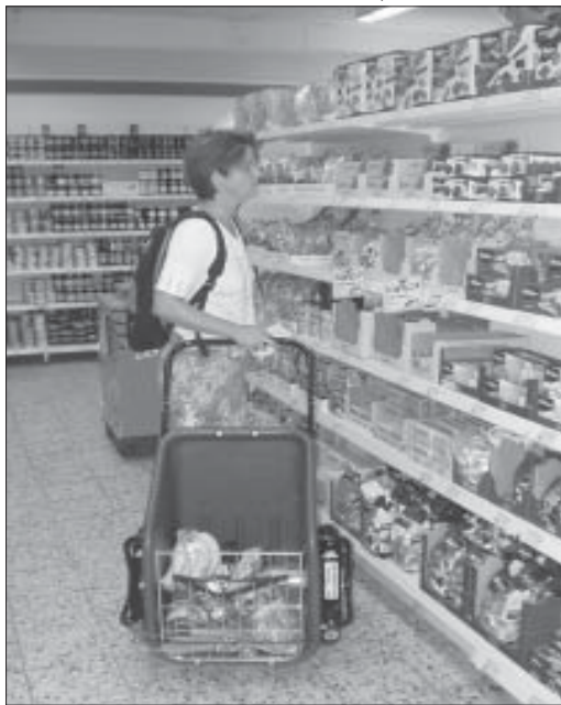
Probezeit mit dem „Donkey“

Die beiden Faltblätter „Einkaufen mit dem Fahrrad“ für EinzelhändlerInnen und für radelnde KundInnen sowie weiteres Material und Infos stehen mittelfristig auf der Kreisgruppen-Homepage zur Verfügung: www.bund-kiel.net Verschickung per Post gegen frankierten Rückumschlag: BUND-Kreisgruppe Kiel , Olshausenstr. 12, 24118 Kiel, Tel. 0431-801312, e-mail: bund.kiel@bund.net