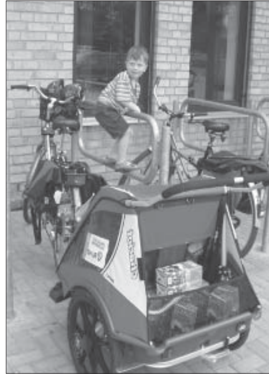
Probezeiter testet den „Kieler Bügel“

Die beiden Faltblätter „Einkaufen mit dem Fahrrad“ für EinzelhändlerInnen und für radelnde KundInnen sowie weiteres Material und Infos stehen mittelfristig auf der Kreisgruppen-Homepage zur Verfügung: www.bund-kiel.net Verschickung per Post gegen frankierten Rückumschlag: BUND-Kreisgruppe Kiel , Olshausenstr. 12, 24118 Kiel, Tel. 0431-801312, e-mail: bund.kiel@bund.net