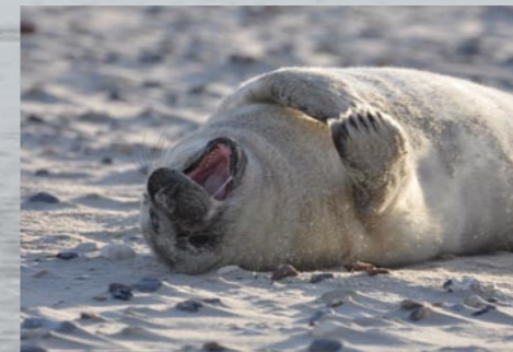
4 Junge Kegelrobbe

Kegelrobbenbabies kommen im Winter zur Welt, Seehunde werden im Sommer geboren. Trotzdem brauchen beide eine dicke Speckschicht, um im Wasser nicht auszukühlen. Die Milch der Muttertiere hat ca. 50% Fettanteil, damit kann ein Jungtier schnell Gewicht gewinnen. Auch für den Zeitraum, in dem sie lernen, selbst erfolgreich zu jagen, brauchen sie eine Reserve. Neugeborene Schweinswale werden ebenfalls gesäugt. Das erledigen Mutter und Kalb allerdings unter Wasser und nicht wie Seehunde und Kegelrobben auf der Sandbank oder am Strand.